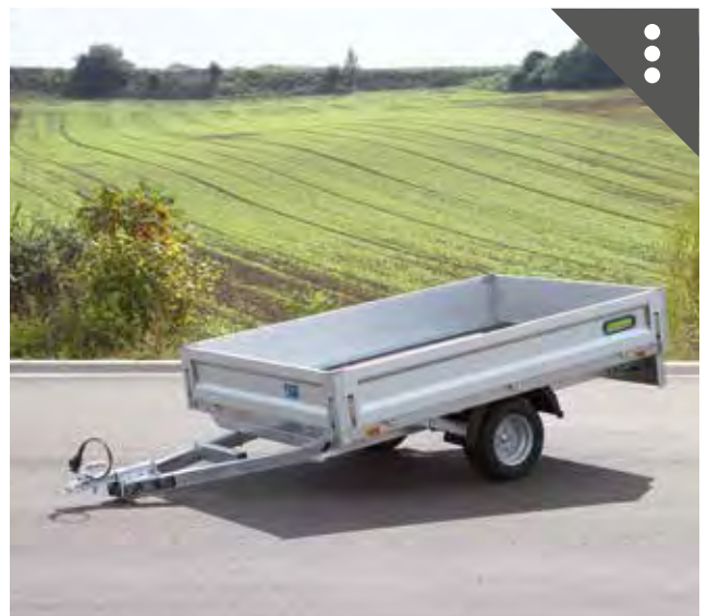
Modell P 823-10-1500 ungebremst