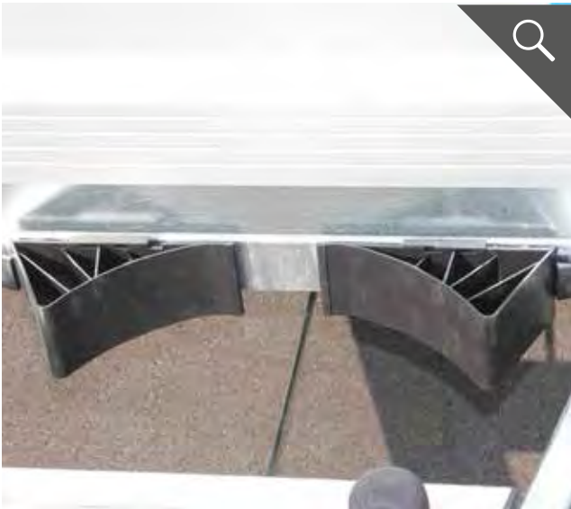
Unterlegkeile für einen festen Stand