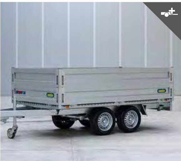
Bordwandaufsatz für mehr Ladevolumen