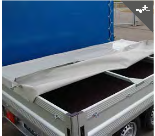
Flachplane mit Querstreben für den wetterfesten Transport