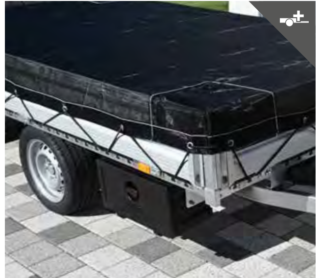
UNSINN Profi-Netzabdeckung mit verstärkten Ecken