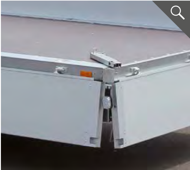
Steckbare und abnehmbare Stahl-Eckrungen für eine einfache Beladung