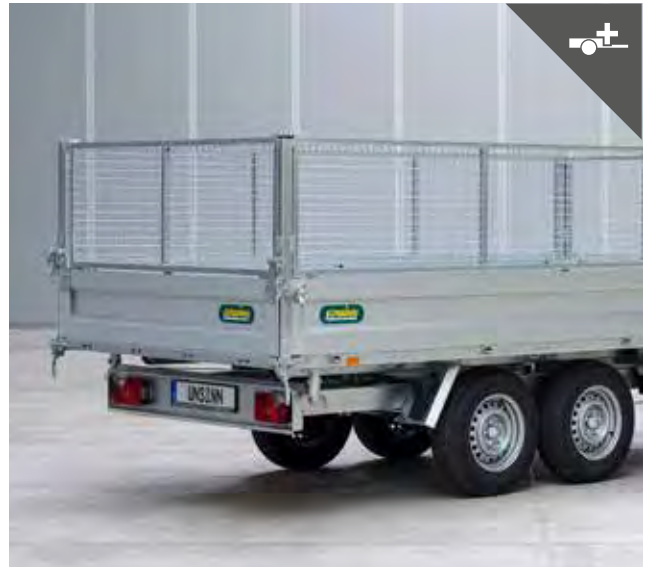
Welldrahtgitteraufsatz für mehr Ladevolumen