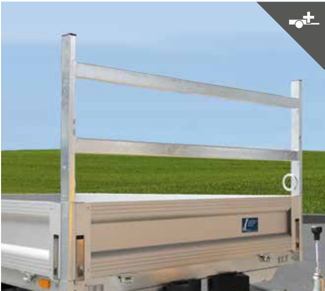
Zweireihiges H-Gestell für flexiblere Transportmöglichkeiten