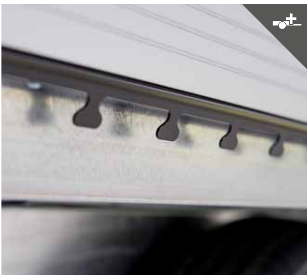
Netz- und Planenleiste für einfaches Befestigen