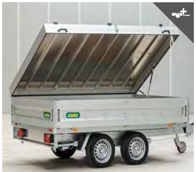
Aludeckel für den Schutz des Ladeguts