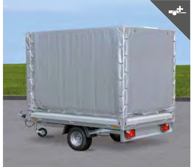
Plane und Gestell für wetterfesten Transport