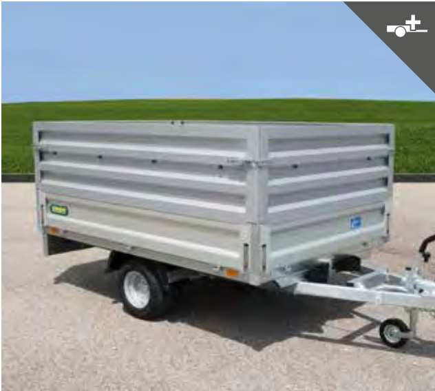
Leichtgutaufsatz für mehr Ladevolumen z. B. von Geäst oder Rasenschnitt