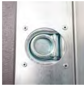
4 - 6 Zurrmulden versenkt im Bodenrahmenprofil, Dekra zertifiziert