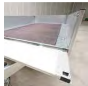
Eloxierte Aluminium-Bordwände vierseitig abklapp- und abnehmbar