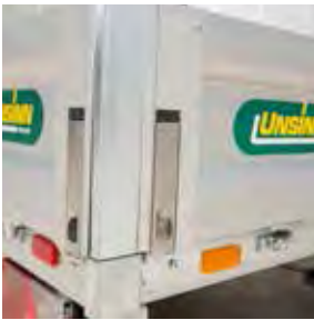
Versenkte Bordwandverschlüsse aus Edelstahl